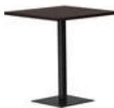
RQ Light t-2004