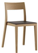
Lyra Szena 6-573